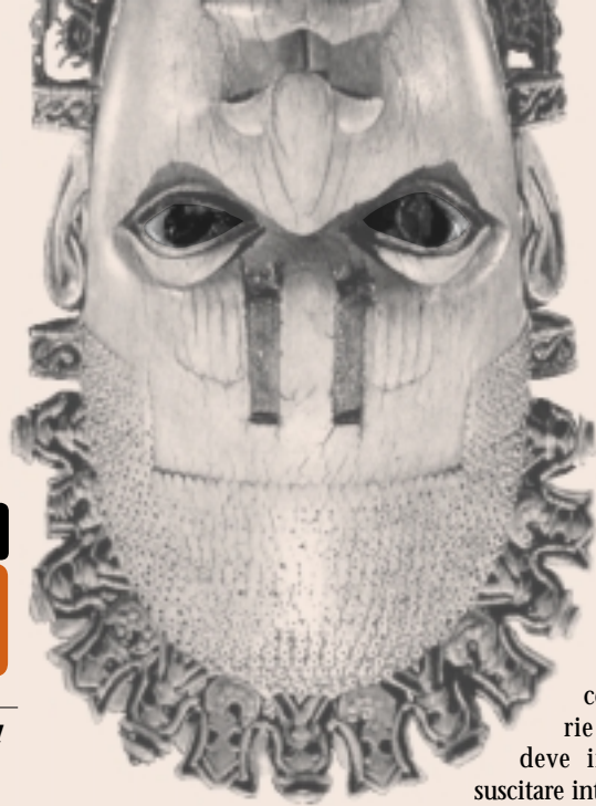
MASCHERA IN AVORIO, DEL XVI SECOLO, DA BENIN CITY