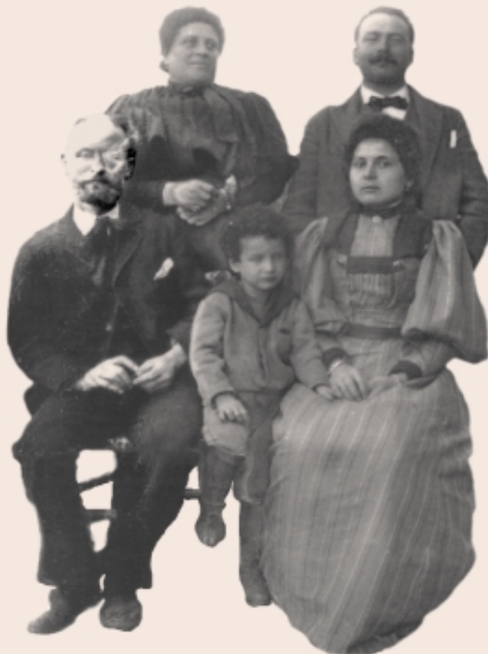
Le immagini di questa sezione sono tratte dal libro "Giovanni Verga fotografo". Giuseppe Maimone Editore, 1991

La mia sensazione è che oggi il teatro stia andando benissimo. Il pubblico si è rinnovato, sicuramente a causa della famosa crisi di valori e del basso livello ormai raggiunto dalla televisione. Io voglio credere, anzi so per certo, che la gente non è al livello dei programmi proposti in TV; sono così le persone che gestiscono le reti televisive, ma non tutti gli spettatori. Oggi si cerca nel teatro la partecipazione a un evento puro, vivo, che avviene qui e ora, in contrapposizione con ciò che viene proposto dagli altri mezzi, che è mediato, artefatto, costruito prima. Si ha la curiosità e il bisogno di un evento privato e aggregante: nei momenti di crisi è naturale cercare l'aggregazione. Io mi ritengo una spettatrice media, vera, non un'adetta ai lavori. Quando vado a teatro riesco davvero a dimenticare i preconcetti e a volte posso ricevere delle emozioni anche da qualcuno che non usa perfettamente i propri mezzi. Oggi c'è bisogno di abbandono, di uno spettatore che si lasci andare a seguire una storia, che sia disposto a identificarsi e a ricevere un'informazione. Il teatro non ha bisogno di intellettuali, non è più come ai tempi di Brecht: la cultura è più fruibile, il pubblico è più maturo e preparato e non c'è più la necessità di un approccio esclusivamente razionale.