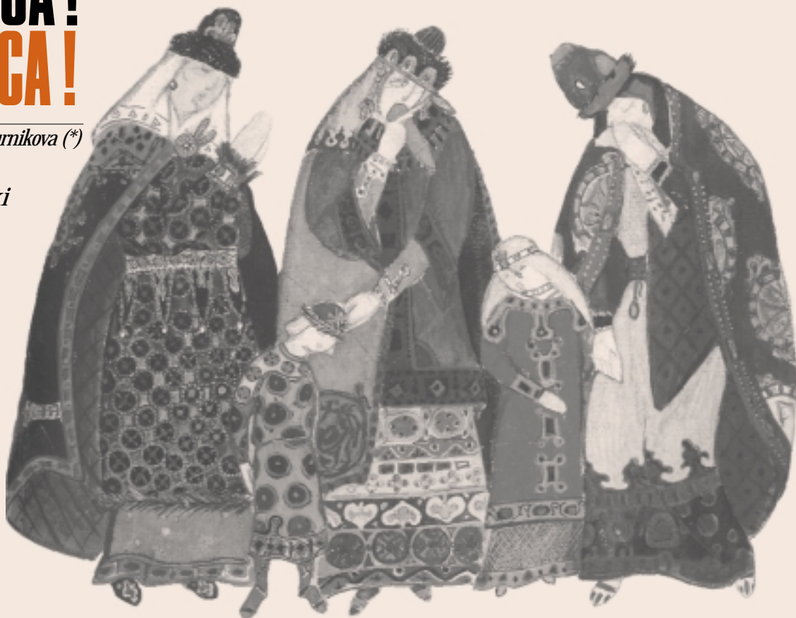
N. K. RERICH BOZZETTO DI COSTUME PER IL PRINCIPE IGOR LA BOIARA E I FIGLI, 1912

Da Dostoïevski a Tourguénev: a Mosca si riscopre la letteratura. Con un messaggio: "Dobbiamo vivere".