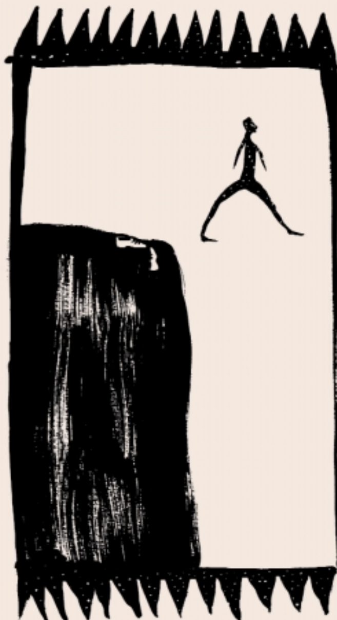
ILLUSTRAZIONE DI FABIAN NEGRIN