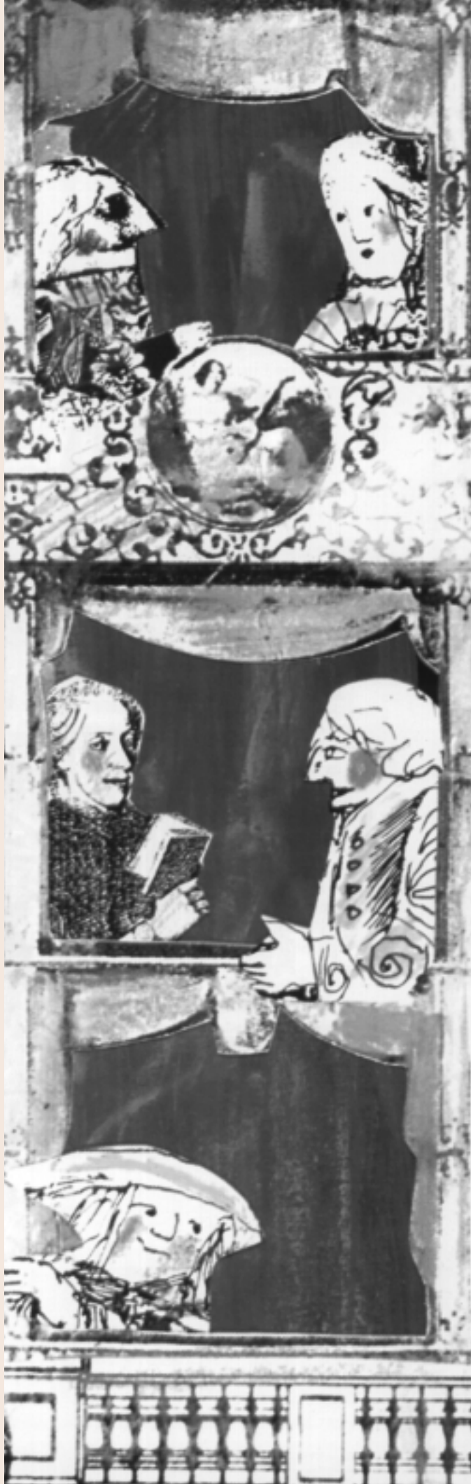
DA UN SCENOGRAFIA DI EMANUELE LUZZATI

D. A proposito della partecipazione del pubblico, si immagina che gli spettatori di quattro secoli fa, che assistevano ai drammi appena scritti di Shakespeare, si entusiasmassero con il cuore e con le emozioni alla vicenda delle sue tragedie. Ma era davvero così, oppure in idee del genere c'è anche un po' di mito?