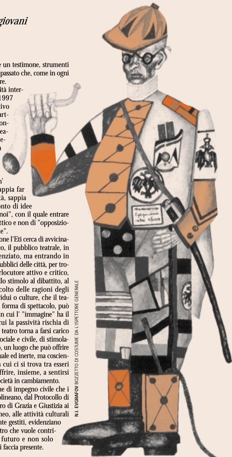
N.I. EVGRAFOV BOZZETTO DI COSTUME DA L'ISPETTORE GENERALE

La forte connotazione di impegno civile che i progetti dell'Eti sottolineano, dal Protocollo di Intesa con il Ministero di Grazia e Giustizia ai Porti del Mediterraneo, alle attività culturali dei Teatri direttamente gestiti, evidenziano l'impegno di un Teatro che vuole contribuire a costruire il futuro e non solo restare in attesa che si faccia presente.