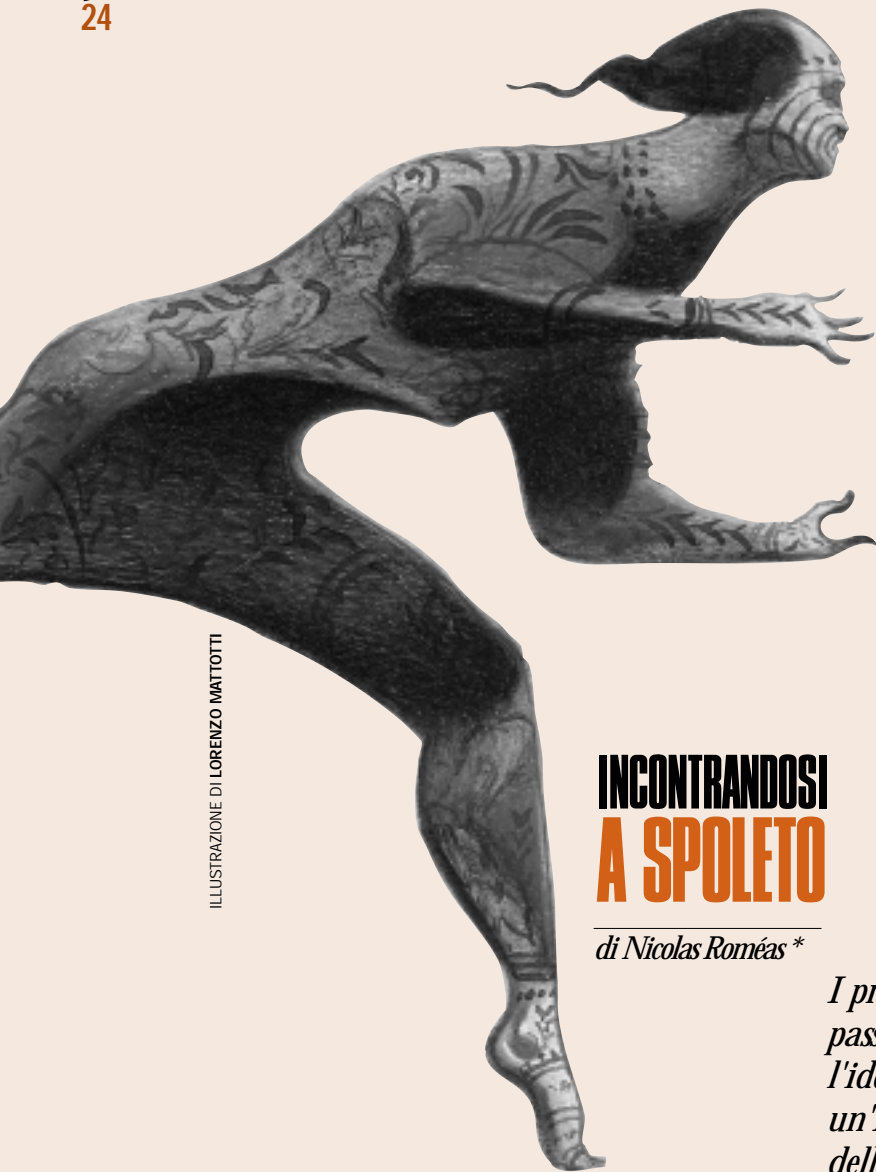
ILLUSTRAZIONE DI LORENZO MATTOTTI