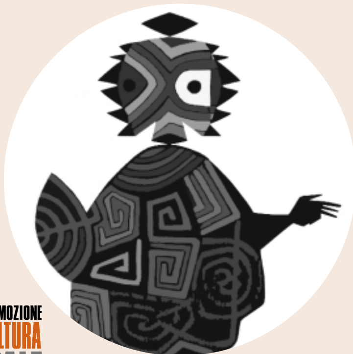
CORRADO CAGLI COSTUME PER IL GRUPPO DEGLI STREGONI DA FANTASIA INDIANA

Se la scena tenta - faticosamente - di rinnovarsi, di trovare nuovi linguaggi e nuovo pubblico, così la "critica" deve - pena la progressiva scomparsa - sapersi rigenerare, scoprendo nuovi stili comunicativi, parlando di giovani generazioni (e facendole parlare). Nella generale crisi dell'informazione - segnata da una costante e preoccupante diminuzione di spazi e di attenzione - è ancor più necessario fare sentire la voce del teatro: in modo chiaro, senza compromissioni o corporativismi, fanatismi o cripicisms, contribuire alla vitalità e alla necessità dell'arte scenica.