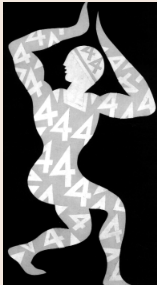
DEPERO COSTUME CIFRATA 1929

Un altro dei motivi portanti del nuovo disegno di legge riguarda proprio lo sfruttamento del patrimonio di esperienze che possiede l'Eta. L'Eta si trasformerà nel nuovo Centro Nazionale per il Teatro, che in parte svolgerà funzioni già affidategli oggi, ma per il resto ne riceverà altre, centrali per il funzionamento dell'intero sistema teatrale. Mi riferisco, ad esempio, alla distribuzione delle risorse pubbliche, ora garantita dal Dipartimento dello Spettacolo. Nell'operare questo trasferimento di funzioni, si è contato proprio sull'esperienza del personale dell'Eta, operativo nel settore da tanti anni e per questo in grado di garantire l'efficienza necessaria nella gestione di questi nuovi edifici del sistema dello Spettacolo.