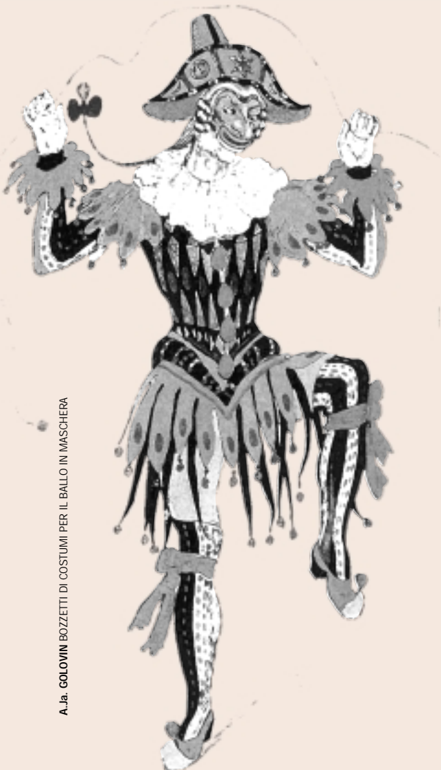
A. Ja. GOLOVIN BOZZETTI DI COSTUMI PER IL BALLO IN MASCHERA

Ma, proprio perché ci muoviamo nell'ambito dei numeri, è giusto sottolineare che tutte le recite sono state inserite all'interno di interventi progettuali mirati, costruiti in collaborazione con gli Enti/Organismi competenti, secondo una strategia di sviluppo e promozione del pubblico, nonché di preferenziale attenzione alle forze emergenti.