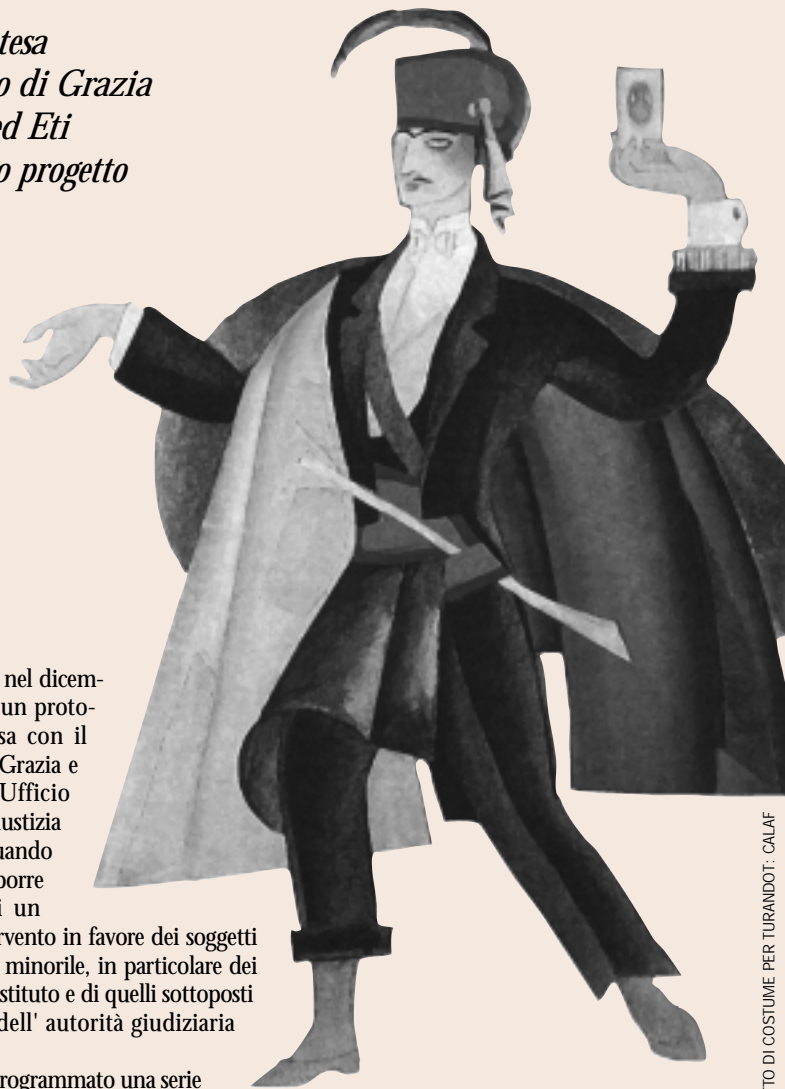
LI. NIVINSKU BOZZETTO DI COSTUME PER TURANDOT - CALAF

Sia l'Eti sia il Ministero di Grazia e Giustizia ritengono opportuno, comunque, ampliare e migliorare il raggio d'azione del progetto, puntando non solo sulla migliore articolazione delle linee di sviluppo progettuali, ma anche sul coinvolgimento di partner transnazionali al fine di predisporre fasi di scambio relative, principalmente, alle metodologie di lavoro.