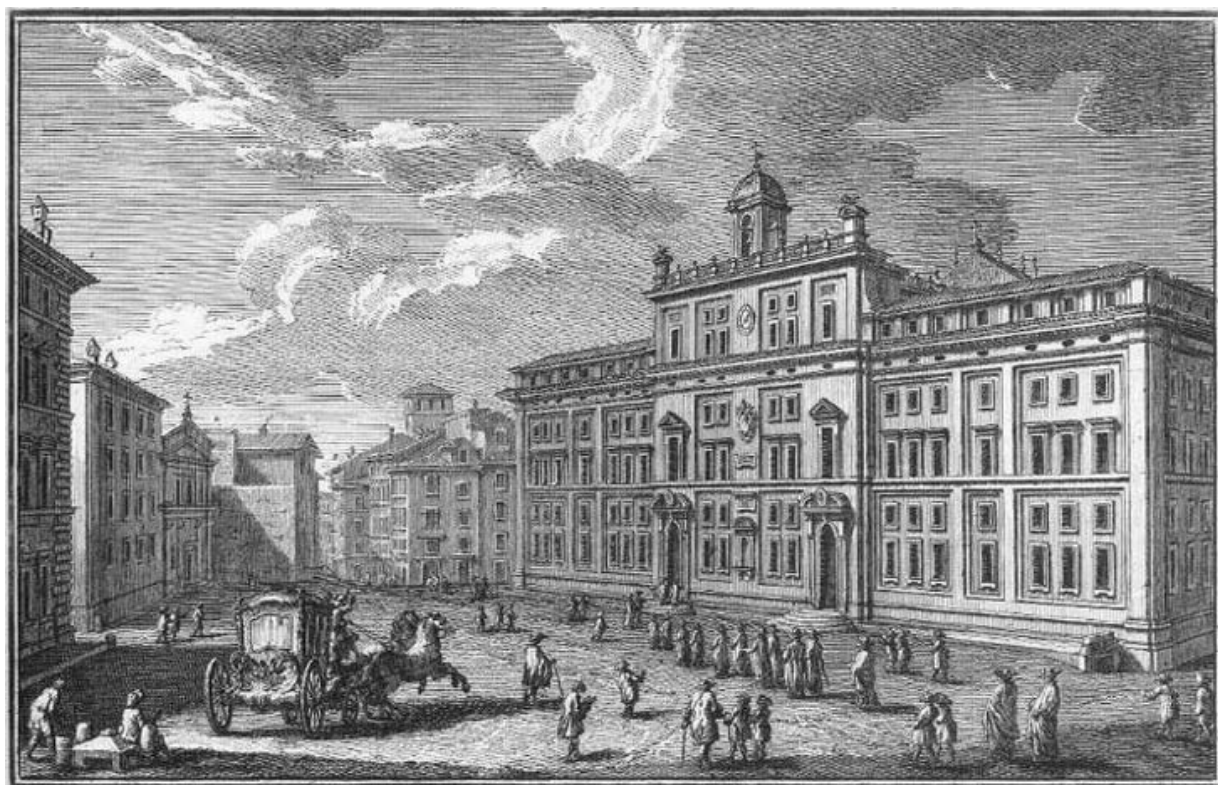
1. Parte del Palazzo Pamphili, 2. Chiesa e monastero di S. Maria delle suore Appollinarie, 3. Strada di piede marmo.

Programma triennale per la trasparenza e l'integrità 2012-2014